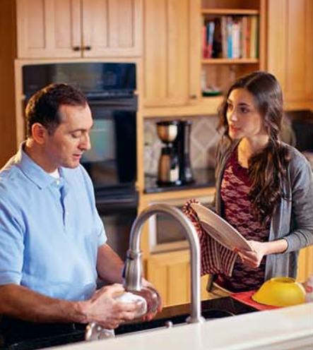
Выслушивайте детей, чтобы ХОРОШО ЗНАТЬ их (Смотрите абзацы 3—9.)