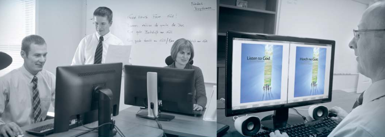
Переводческая группа работает над публикациями на нижненемецком языке (Смотрите абзац 10.)

миллионы людей. Например, миллионы живущих в Испании каталонцев в повседневной жизни общаются на своем родном языке, каталанском. Особенно в последнее время каталанский, а также его варианты, на которых говорят в Андорре, Аликанте, Валенсии и на Балеарских островах, начали возрождаться. В наши дни Свидетели Иеговы выпускают библейскую литературу и проводят христианские встречи собрания на каталанском — языке, который согревает сердца каталонцев.