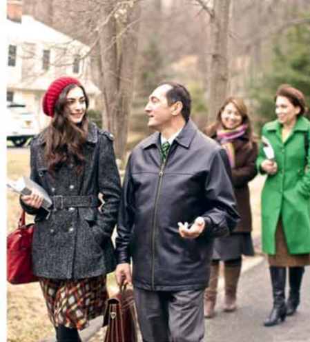
НАПРАВЛЯЙТЕ их на верный путь (Смотрите абзацы 13—18.)

видно, что встречаться с кем-то и узнавать друг друга ближе очень приятно. Поэтому мне легко разговаривать с ними на такие темы. Я хочу, чтобы они были в курсе того, с кем я встречаюсь. Не хочу ничего от них скрывать».